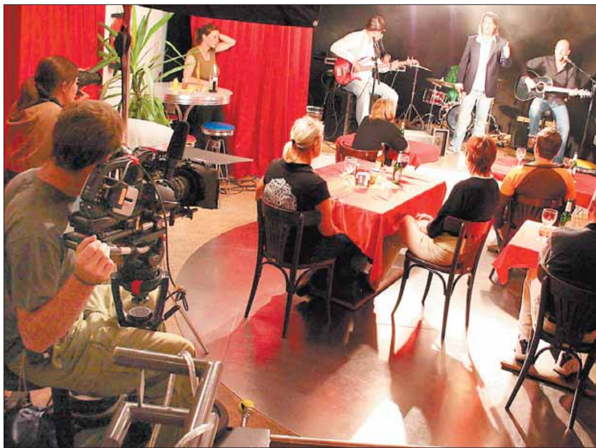
Achtung, Kamera läuft: Alles soll so authentisch wie seiner Band ähneln. Natürlich dürfen auch Zuschauer möglich wirken und einem Live-Auftritt von Mars und nicht fehlen.

Bereits am Samstagabend hat das Team einige Einstellungen auf dem Sportplatz Kleekamp gedreht. Trotz des Zeitdrucks ist die Atmosphäre am Set locker. Mars verrät, dass er selbst momentan weder verliebt, noch verlobt, noch verheiratet sei. »Ich habe keine Zeit für die Liebe«, sagt der gut aussehende dunkelhaarige Sänger